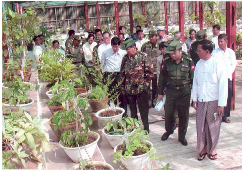
နိုင်ငံတော်အကြီးအကဲ ဗိုလ်ချုပ်မှူးကြီးသန်းရွှေ ဆေးသုတေသနဦးစီးဌာန (အထက်မြန်မာပြည်) တွင် လှည့်လည်စစ်ဆေး၍ လမ်းညွှန်မှုများပေးနေစဉ်