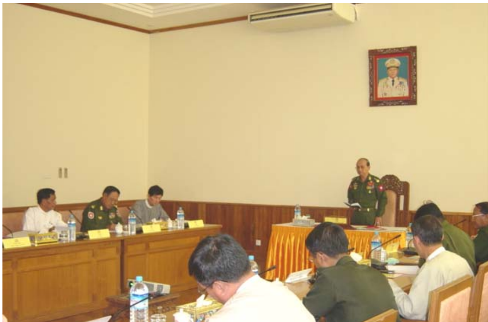
အမျိုးသားကျန်းမာရေးကော်မတီ (၄၄) ကြိမ်မြောက်အစည်းအဝေး

ပြည်နယ်/တိုင်းနှင့် မြို့နယ်အဆင့်တွင်လည်း စီမံကိန်းအကောင်အထည်ဖော်မှု ကြီးကြပ်ခြင်းနှင့် ဆန်းစစ်ခြင်းတို့ကို ပုံမှန်ဆောင်ရွက်လျက်ရှိပါသည်။ ဒေသအဆင့်တိုင်းတွင် အမျိုးသားကျန်းမာရေး စီမံကိန်းအား အကောင်အထည်ဖော် ဆောင်ရွက်ရာ၌ ကျန်းမာရေးနှင့်နှီးနှွယ်သောဌာနများ၊ အစိုးရ မဟုတ်သော အဖွဲ့အစည်းများနှင့် ပူးပေါင်း ဆောင်ရွက်လျက်ရှိပါသည်။